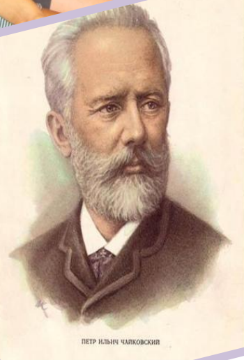
ПЕТР ИЛЬИЧ ЧАЙКОВСКИЙ