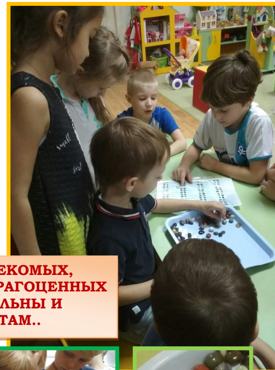
ЕГО РАССКАЗЫ О НАСЕКОМЫХ, СОЛДАТИКАХ, РЫЦАРЯХ, ДРАГОЦЕННЫХ КАМНЯХ ПОЗНАВАТЕЛЬНЫ И ИНТЕРЕСНЫ РЕБЯТАМ..